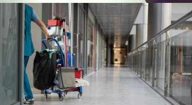
ENTREPRISE DE PROPRETE