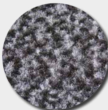
Fibres de polypropylène mouchetées